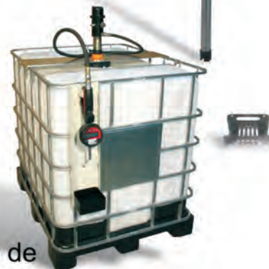
Conjunto para servicio de lubricantes desde contenedor