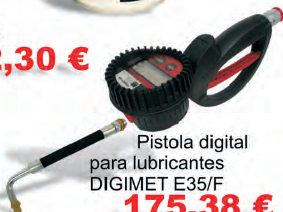
Pistola digital para lubricantes DIGIMET E35/F