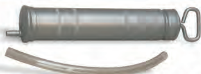
Jeringa para aceite y valvolina S400/1 20,76 €