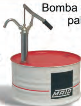
Bomba de trasvase a palanca HP-350