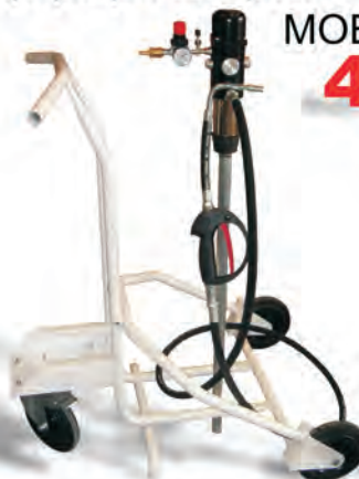
Equipo portátil para servicio de lubricantes